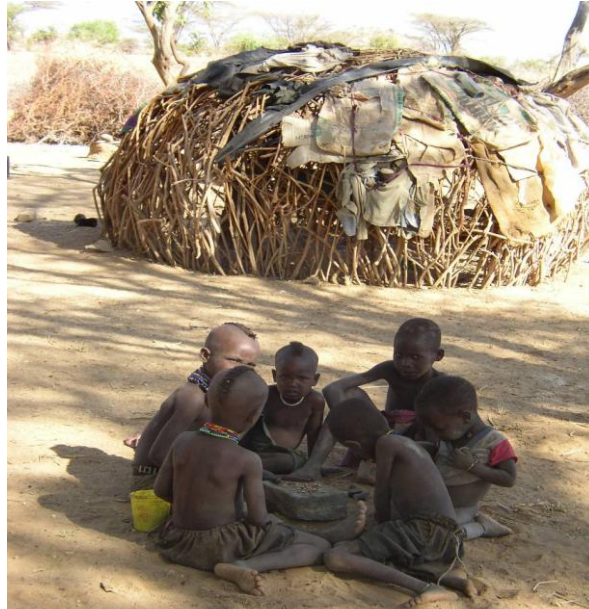
Kinder sind besonders betroffen von den Folgen der Dürre und des Hungers