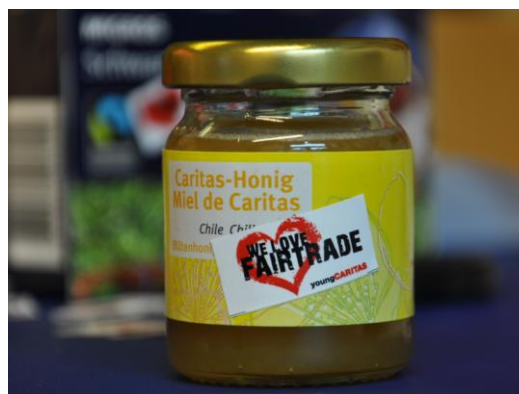
Kleber: WE LOVE FAIRTRADE

Mit den beiden kleinen aber feinen Klebern, die du bei uns bestellen kannst, sieht jedes Fairtrade-Produkt noch ein bisschen besser aus.