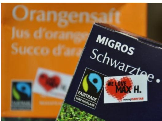
Kleber: WE LOVE MAX H.

Ein Beispiel für einen möglichen Petitions-Text findest du hier .